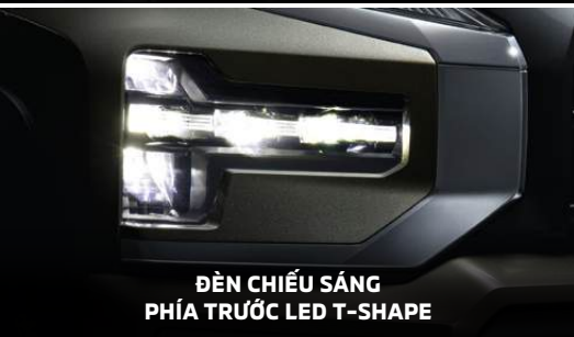
ĐÈN CHIẾU SÁNG PHÍA TRƯỚC LED T-SHAPE