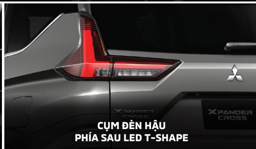
CỤM ĐÈN HẬU PHÍA SAU LED T-SHAPE