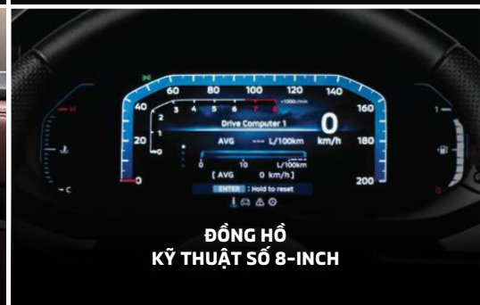
ĐỒNG HỒ KỸ THUẬT SỐ 8-INCH