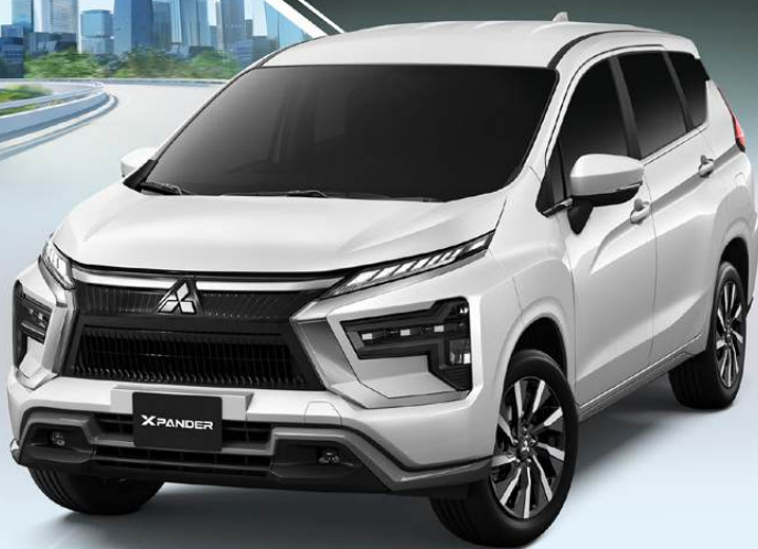
NEW MITSUBISHI XPANDER