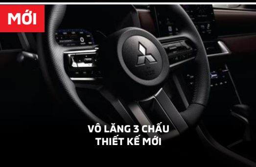
MỚI VÔ LĂNG 3 CHẤU THIẾT KẾ MỚI