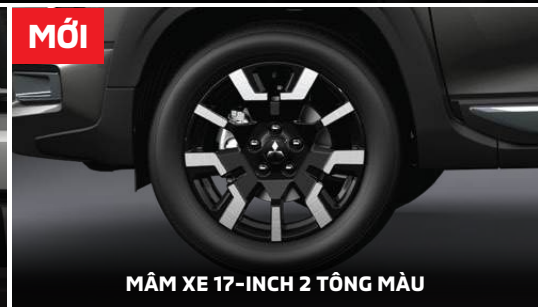
MỚI MÂM XE 17-INCH 2 TÔNG MÀU