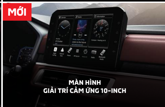
MỚI MÀN HÌNH GIẢI TRÍ CẢM ỨNG 10-INCH