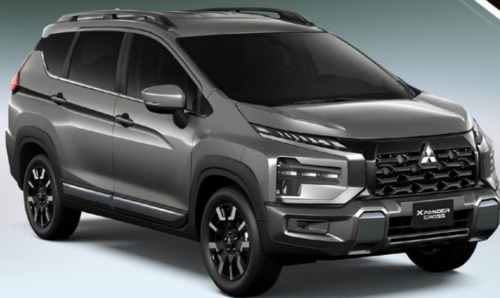
NEW MITSUBISHI XPANDER CROSS